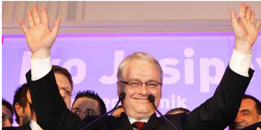
Der Sozialdemokrat Ivo Josipovic feiert seinen Wahlsieg in Zagreb.

Der Wahlsieger bezeichnete seine Wahl als einen Sieg für alle Kroaten. „Ich glaube fest daran, dass wir alle ein besseres, eingerechteres Kroatien wollen“, sagte er in Zagreb. Als Präsident wolle er sich für ein ge-