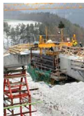
Eiseskälte und Schnee bremsen an vielen Baustellen die Arbeiten.

Sollte sich das eisige Winterwetter nicht bald ändern, dann verliere die deutsche Wirtschaft im ersten Quartal rund zwei Mrd. Euro Wertschöpfung am Bau, sagte Treier dem Blatt. Umgerechnet seien dies rund 0,4 Prozent des Bruttoinlandsprodukts im ersten Quartal.