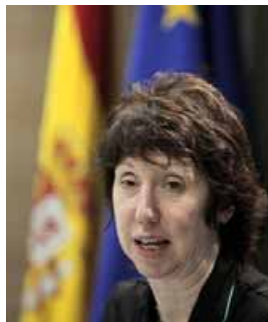
EU-Chefdiplomatin Ashton musste sich den Fragen der EU-Parlamentarier stellen.

Brüssel Mit einer Befragung der neuen EU-„Außenministerin“ Catherine Ashton haben heute in Brüssel die Anhörungen der künftigen EU-Kommission begonnen. Die Britin Ashton und der designierte Kommissar für den EU-Haushalt, der Pole Janusz Lewandowski, waren die ersten Kommissionsmitglieder, die sich dem politischen Verhör stellen mussten. Ashton sagte dabei, die Schaffung eines neuen diplomatischen Dienstes der EU sei ihre „Top-Priorität“. Europa müsse sich außenpolitisch stärker als bisher engagieren: „Und wir müssen dafür