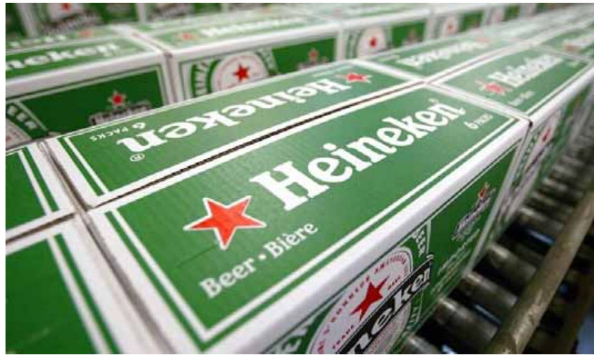
Drängt nach Südamerika: Der Bierbrauer Heineken, hier seine Fabrik in Amsterdam.

Heineken hat wie viele seiner Rivalen - etwa der in Brüssel ansässige Weltmarktführer Anheuser-Busch Inbev - mit dem Schrumpfen des Marktes in Westeuropa zu kämpfen. Die Nummer zwei des Weltmarktes SABMiller erwirtschaftet bereits fast 90 Prozent seines Gewinns in Schwellenländern wie Südafrika, Kolumbien und China. Der in London notierte Brauer hatte auch an dem Bieterrennen um die Femsa-Sparte teilgenom-