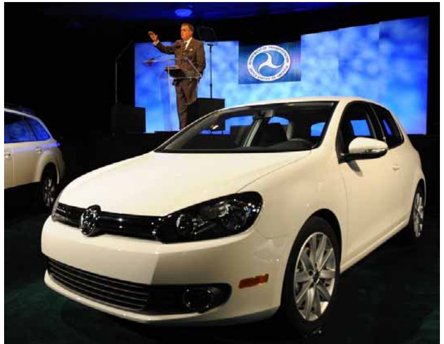
US-Verkehrsminister Ray LaHood spricht vor einem VW-Golf zu Journalisten in Detroit.

Der deutsche Autobauer Volkswagen hat bereits ehrgeizige Ziele für den welt-