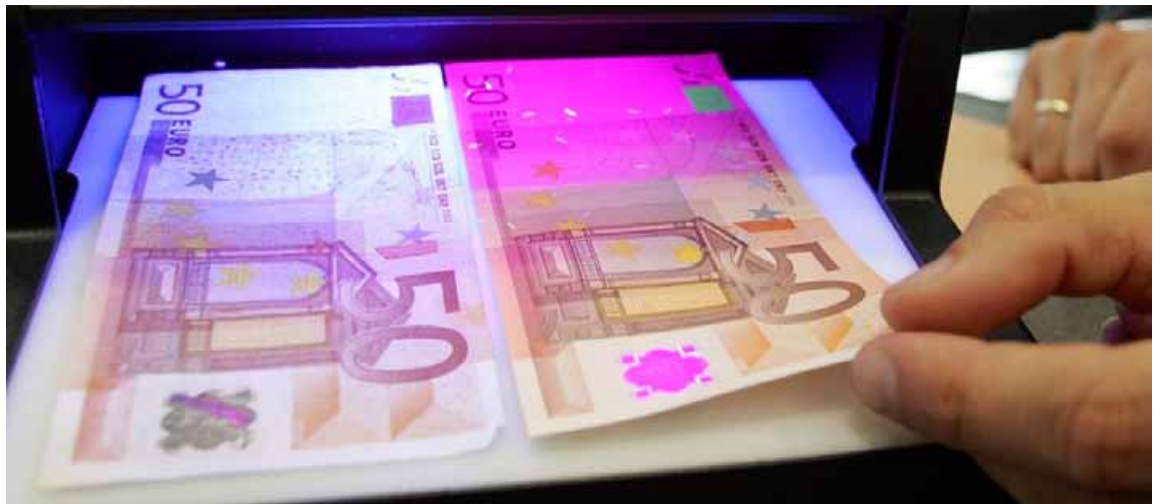
Moment der Wahrheit: Die UV-Lampe entlarvt den linken 50-Euro-Schein als Fälschung

Spitzenreiter im Dax war einmal mehr die Commerzbank, deren Aktien sich zeitweise um drei Prozent auf 7,02 Euro verteuerten. Seit Jahresbeginn haben sie damit knapp 19 Prozent zugelegt - mehr als jeder andere Wert in der ersten deutschen Börsenliga.