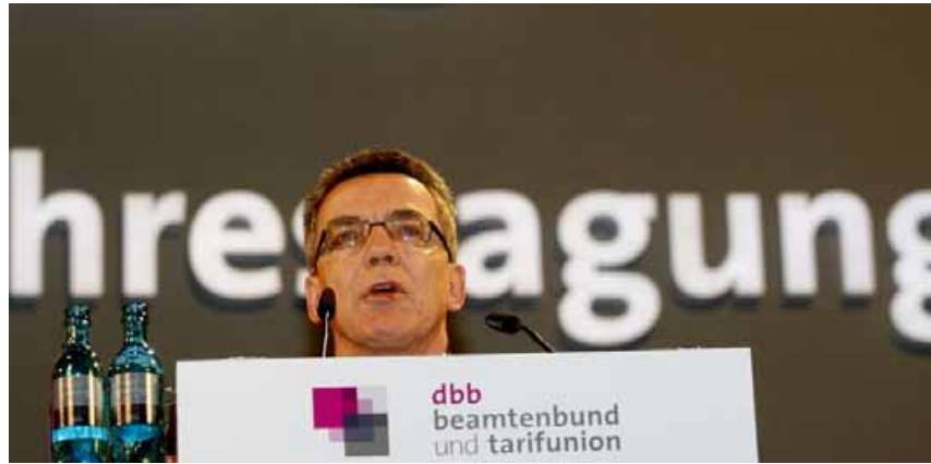
Bundesinnenminister Thomas de Maizière plädiert für moderate Tarifierhöhungen.

Bundesinnenminister de Maizière weist Tarifforderungen zurück