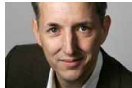
Florian Kolf Handelsblatt

Wer bei der Detroit Motor Show über die sogenannte „Electric Avenue“ läuft, der könnte meinen, die Umweltbelastung durch den Autoverkehr wäre in Kürze ein Problem der Vergangenheit.