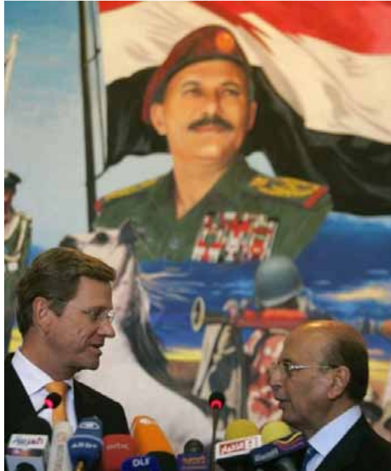
Außenminister Westerwelle (li.) mit seinem jemenitischen Amtskollegen Abu-Bakr al-Qerbi in der Stadt Sanaa.

Die jemenitische Führung steht auch wegen der