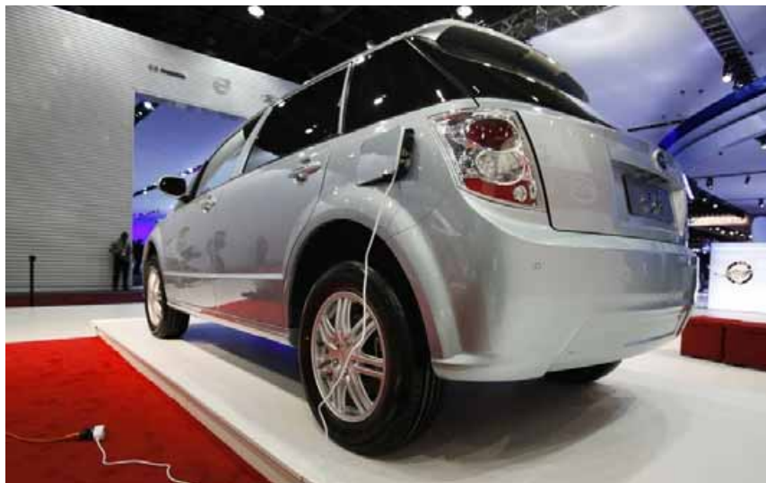
Hoffnungsträger auf der Messe in Detroit: Ein Modell für ein Elektroauto (Build Your Dreams)

In den weltweit 25 Megacities (mehr als zehn Mio. Einwohner im Ballungsraum) werden zehn Prozent des globalen Kohlendioxid-Ausstoßes verursacht. Deshalb sind sie nach Meinung von McKinsey „die natürliche Umgebung für das Entstehen von Elektromobilität“. Zur Verbreitung von Elektroautos ist in der Anfangsphase keine dichte öffentliche Lade-Infrastruktur notwendig. „Die Chancen der Elektromobilität werden bislang meist danach beurteilt, wie schnell