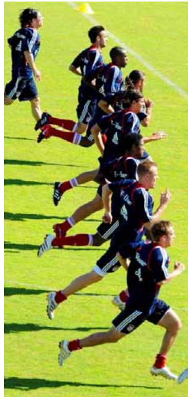
Sturmlauf zur Meisterschaft: Bayern-Spieler beim Training in Dubai.

dpa | Düsseldorf Der FC Bayern München bleibt der große Titelfavorit in der Fußball-Bundesliga. Dies ist die Meinung der Trainer der 18 Erstligisten, die sich an einer Umfrage vor dem Start in die Rückrunde beteiligten. Demnach trauen 14 Fußball-Lehrer - Mehrfachnennungen waren möglich - dem Rekordmeister in dieser Saison den Titel zu, obwohl der FC Bayern seit 51 Spieltagen nicht mehr an der Tabellenspitze stand. Tabellenführer Bayer Leverkusen wurde immerhin noch viermal genannt. Vor der Saison hatten 16 von 18 Trainern den FC Bayern als eindeutigen Meisterschaftsfavoriten genannt. Die Trainer, die sich nicht auf einen Club festlegen wollten, nannten zudem noch den FC Schalke 04 (2x) und je einmal den Hamburger SV und Werder Bremen. Neben Michael Frontzeck (Borussia Mönchengladbach) wollte auch Louis van Gaal keine Prognose wagen. „Einen Tipp gebe ich nicht ab. Unser Ziel ist die Meisterschaft“, sagte der Niederländer, unter dessen Regie der FC Bayern in 26 Pflichtspielen seit Sommer vier Niederlagen hinnehmen musste. Den Rückstand auf den Spitzenreiter Le-